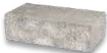
błoczek standardowy dwustronnie łamany 25×60×15 cm