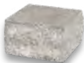
błoczek półkowy trójstronnie łamany 25×30×15 cm